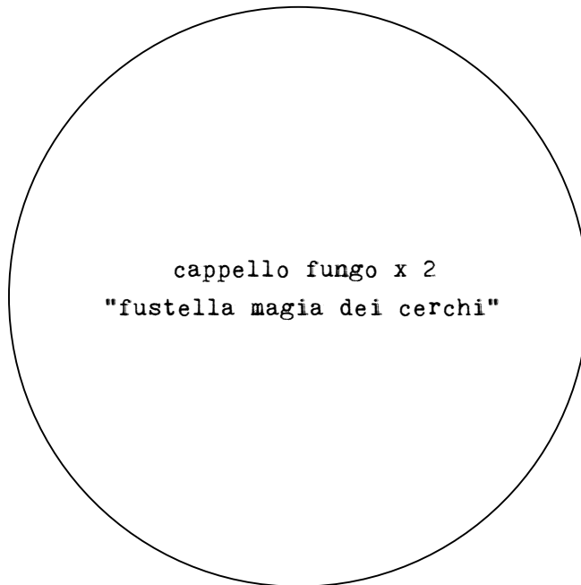
cappello fungo x 2 "fustella magia dei cerchi"